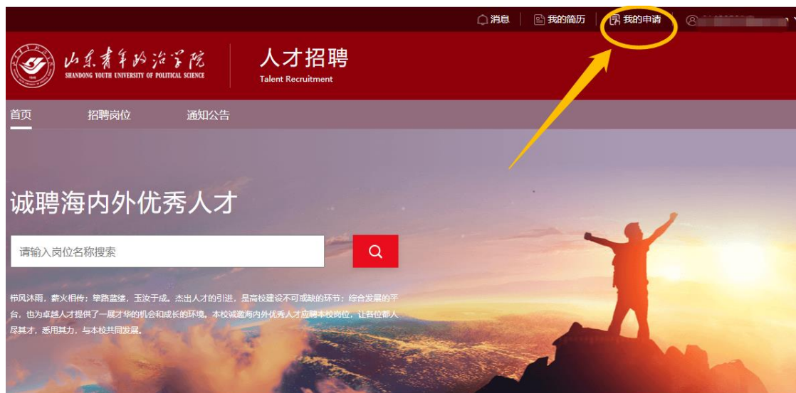
图 1 我的申请

3. 通过【我的申请】页面查看审核日志、审核状态流程图。在审核日志中查看具体审核意见。